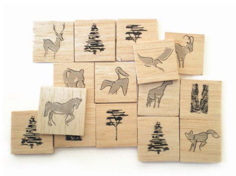
Εικόνα 4: Ξύλινα ταμπελάκια