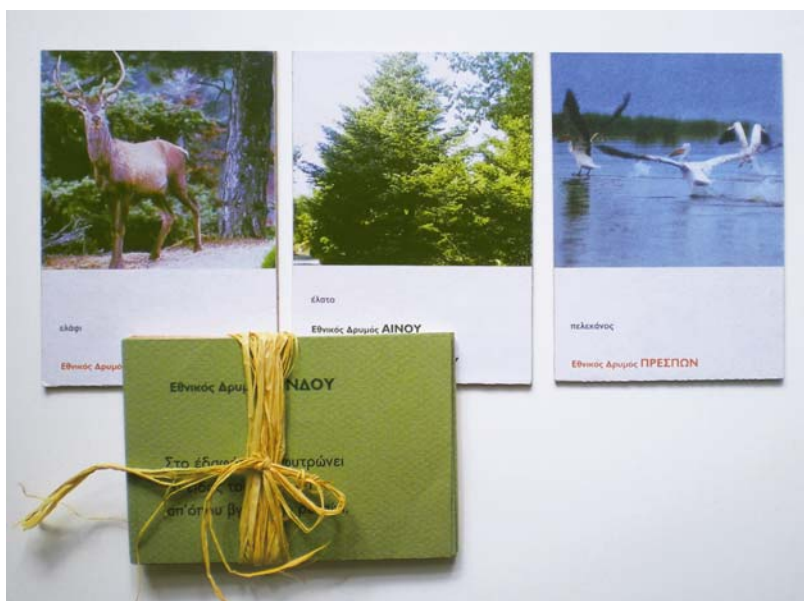
Εικόνα 3: Κάρτες ερωτήσεων και κάρτες επαλήθευσης