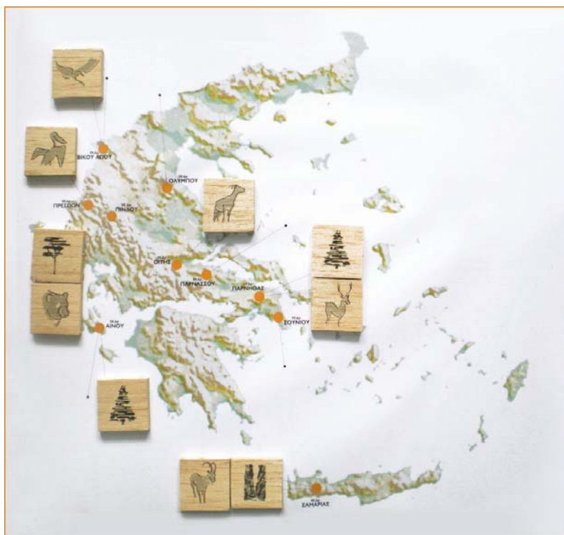
Εικόνα 5: ...συμπληρώνοντας τον χάρτη

Για την επαλήθευση χρησιμοποιούνται κάρτες με την ονομασία του κάθε Δρυμού και φωτογραφίες των ζητούμενων στοιχείων του στο φυσικό τους περιβάλλον. Το υλικό αυτό δύναται να αποτελέσει πηγή παρατήρησης ως προς τα χαρακτηριστικά των ζώων και κυρίως των δένδρων, καθώς και του τρόπου ανάπτυξης του δάσους που σχηματίζουν, π.χ μικρά έλατα που φυτρώνουν στην σκιά των μεγάλων, δημιουργώντας τα δάση της κεφαλληνιακής ελάτης που συναντώνται στον Αίνο, την Οίτη, τον Παρνασσό και την Πάρνηθα. Στην Πίνδο απαντώνται πυκνά δάση που αποτελούνται από μαύρη πεύκη, στο Σούνιο συναντάται σχετικά αραιή βλάστηση χαλέπιου πεύκης ενώ το σπάνιο είδος πεύκου, το ρόμπολο, δημιουργεί αμιγές δάσος στον Όλυμπο.