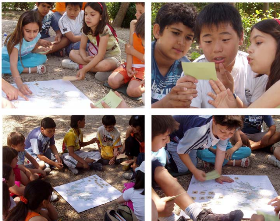
Εικόνα 6: ...συμπληρώνοντας τον χάρτη στον Εθνικό Κήπο