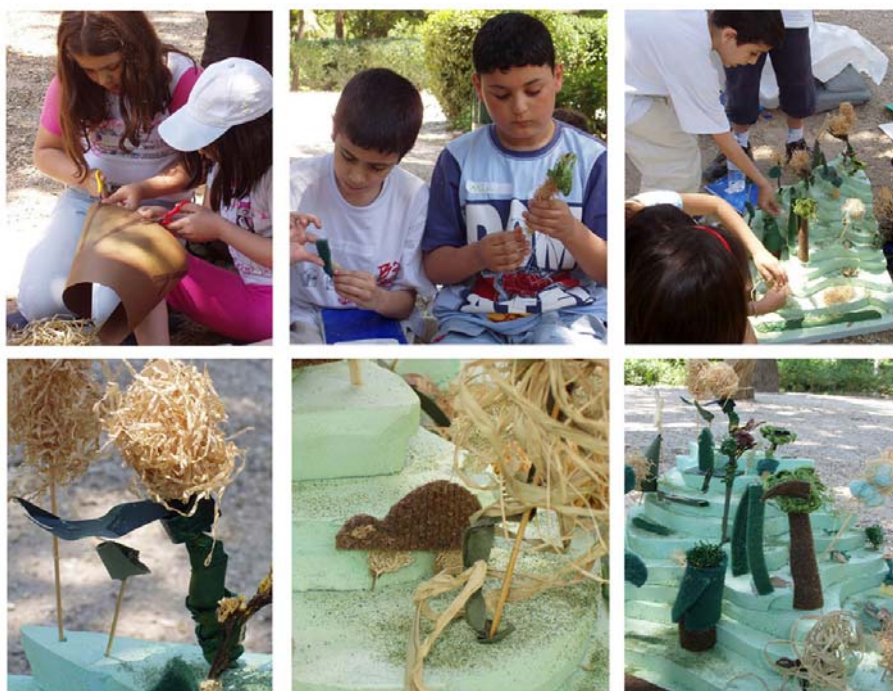
Εικόνα 7: ...κατασκευάζοντας δέντρα και ζώα των Εθνικών Δρυμών