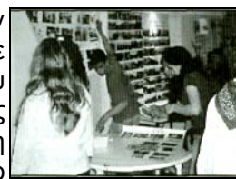
Τα παιδιά των περιβαλλοντικών ομάδων σε δράση!

Ποικίλα τα θέματα που είχαν διαπραγματευθεί οι μαθητές, με κυρίαρχο αυτό του νερού που απασχόλησε 8 από τις 39 ομάδες που εργάστηκαν φέτος. Έναρξη των παρουσιάσεων έγινε με το " Μουσικό Καλωσόρισμα από τη Σαντορίνη, στη Σαντορίνη για τη Σαντορίνη " από τη μουσική ομάδα του Γυμνασίου