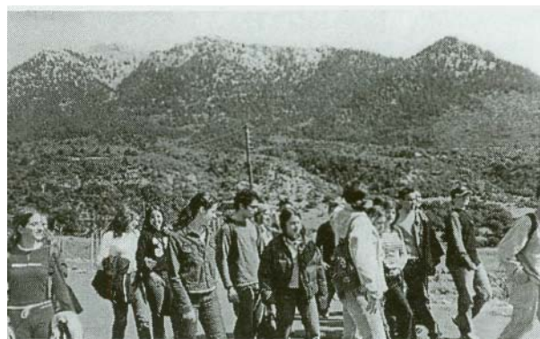
Στιγμιότυπο από την εκπαιδευτική επίσκεψη της περιβαλλοντικής ομάδας στο Κ.Π.Ε. Κλειτορίας.

Οι εκπαιδευτικές επισκέψεις σε Κ.Π.Ε. λειτουργούν επίσης ως κίνητρο για τη συμμετοχή των μαθητών σε δραστηριότητες με τις οποίες αποκτούν περιβαλλοντική συνείδηση και βιωματική γνώση. Επικοινωνώντας με τη γενιά που «γεύτηκε» το «χρώμα» μιας άλλης εποχής γνωρίζουμε την ιστορία της πόλης μας.