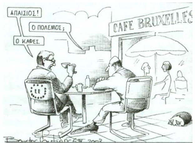
του Βαγγέλη Παυλίδη, ΒΗΜΑ, 6/4/2003