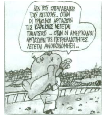
του Γιάννη Δερμεντζόγλου, Ελευθ.Τύπος, 13/4/2003