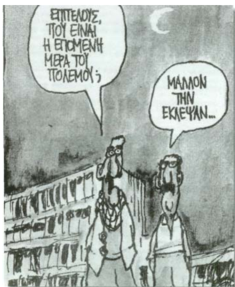
του Γιάννη Δερμεντζόγλου, Ελευθ.Τύπος, 13/4/2003

Κανένας δεν είναι τόσο ανόητος, ώστε να προτιμά τον πόλεμο από την ειρήνη. Διότι στην ειρήνη τα παιδιά θάβουν τους γονείς, ενώ στον πόλεμο οι γονείς θάβουν τα παιδιά τους Ηρόδοτος