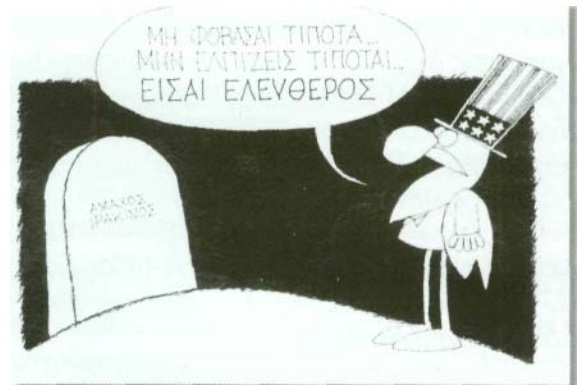
του ΚΥΡ, Ελευθεροτυπία, 29/3/2003