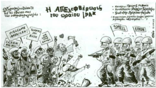
του Θεό, ΕΘΝΟΣ, 13/4/2003