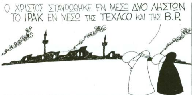
του ΚΥΡ, Ελευθεροτυπία, 19/4/2003