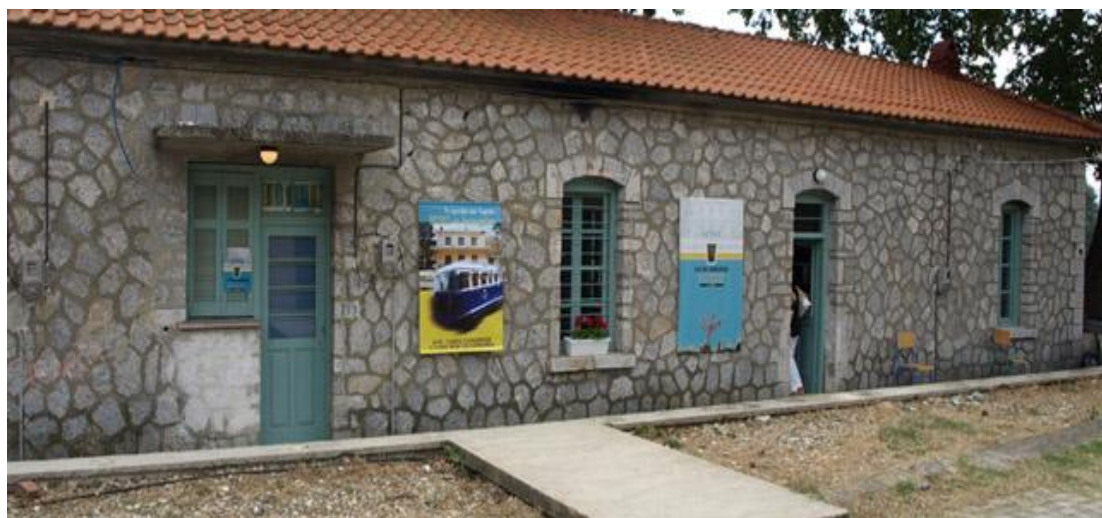
Εικόνα 1: Το Κέντρο Ενημέρωσης «ΔΡΥΑΣ», σε κτίριο του πρώην Σιδηροδρομικού Σταθμού Τεμπών

Αποτέλεσμα της προσπάθειας για την ανάδειξη και την παιδευτική αξιοποίηση της ιδιαίτερης φυσιογνωμίας του Πηνείου και της ευρύτερης περιοχής των Τεμπών είναι η δημιουργία εκπαιδευτικών προγραμμάτων και εκπαιδευτικού φακέλου με το γενικό τίτλο “Της θάλασσας και του βουνού οι θησαυροί του Πηνείου” , εγκεκριμένο από το τμήμα Β΄ Αγωγής Υγείας και Περιβαλλοντικής Αγωγής του Υπουργείου Παιδείας Δια Βίου Μάθησης και Θρησκευμάτων με Αριθμ Πρωτ. 69421/Γ714/7/2010.