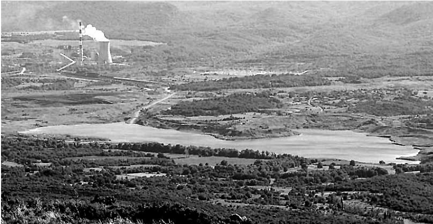
Πανοραμική άποψη της λίμνης